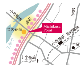
桜堤の正式名称は「千曲川堤防治い」。全長4kmに約600本の八重桜が植えられています。

ここはウォーキングにも最適な場所なので、ぜひ多くの方にこの爽快感を味わっていただきたいです。